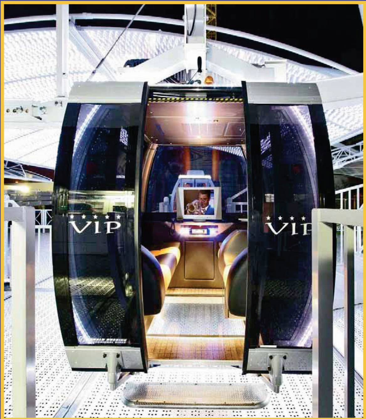
La nacelle VIP est équipée d'une TV, de sièges cuir et d'un réfrigérateur